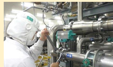
配管系のバルブ交換