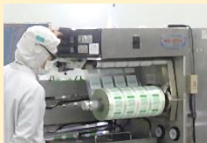
真空包装機の調整