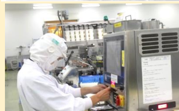
X線異物検査機の設定